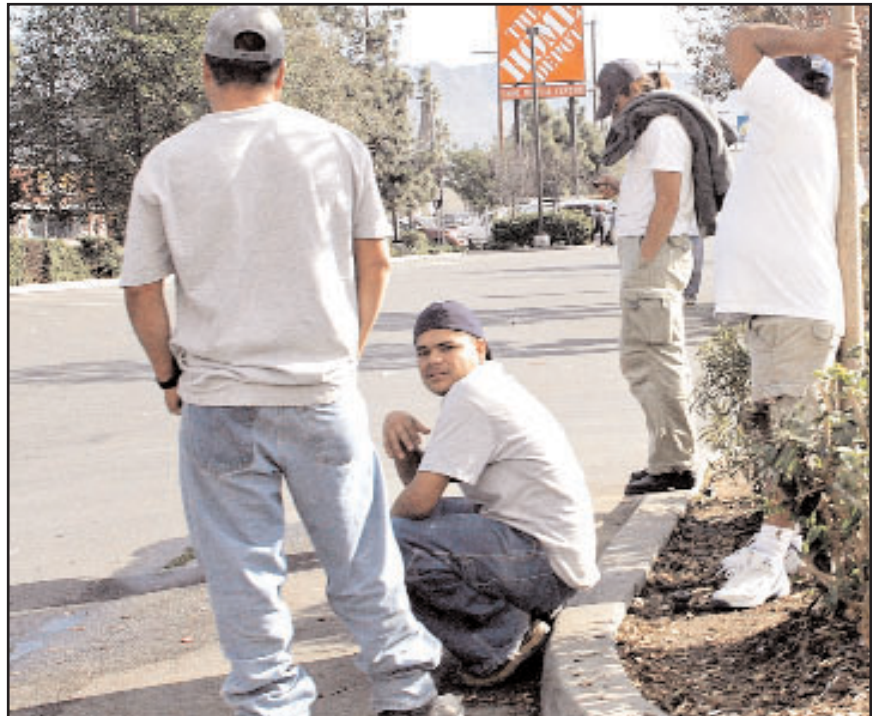
El gobierno mexicano considera importante que los indocumentados en EU obtengan su regularización con sus derechos y obligaciones.