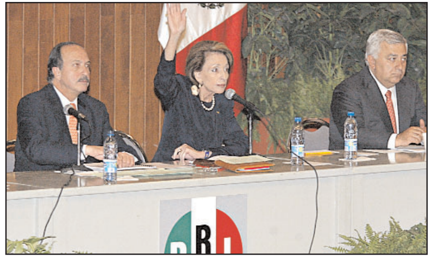
Sesión del Consejo Político Nacional del PRI; en el presidium el senador Carlos Chaunam, Rosario Green y Emilio Chuayffet.