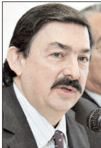
Napoleón Gómez Urrutia