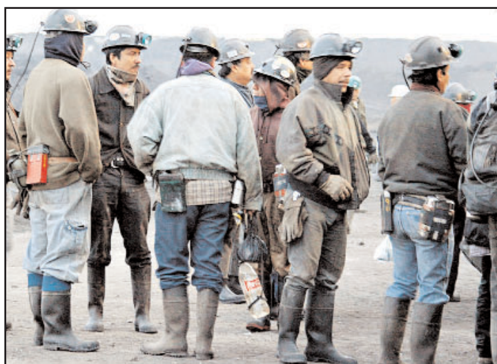
Los trabajos serán realizados por 185 trabajadores y técnicos.

En esta sesión que fue privada, dijo que "el sindicato no es del gobierno, ni de las empresas y menos de los enemigos y de oportunistas que en estos tiempos han surgido, es de los agremiados mineros, ellos son quienes tienen la última palabra, por lo que vamos a defender con todo a nuestro sindicato".